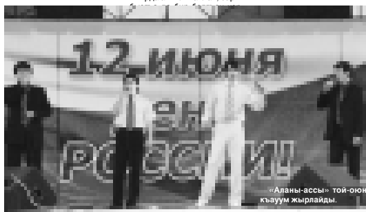
«Аланы-ассы» той-юн кыуун кырайдды.