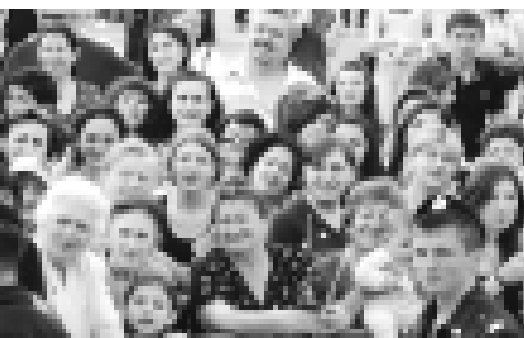
Акыры 2-чи беттеди.