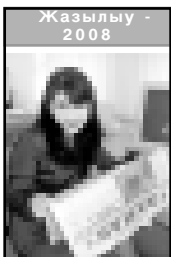
Жазылыу - 2008

сёзонде аны Россияни тууган кюноне окуна санарга болуугун айтканды. Неж дегенде демократияны, азатлыкны, шуддорларын да жан-таныштарындан кыралын башланганды.