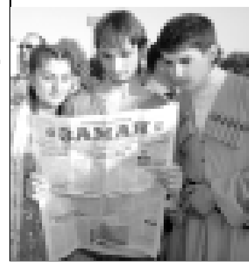
Хурметли жаматат! «Заман» - милдеттиздин жангыз газетиди. Аны беттеринде малкър, тарыхны, бюгонюну жашаууну, айтхылык адамдарынын эмда жашууларынын юсюнден басмаланган тынгылы материалланы сиз бир башка изданинда табалык тойлосыз. Алайды да, себеп болуугузу, кесиптиз газетигизге, жазылыгыз! Сокууранмасыз, тюз сайауу этгенгизге туюшпюрсөз.