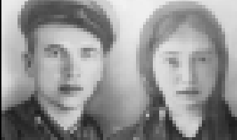
Офицер Балаланы Исмайлыны (Маммут Балкан) биринчи ойдегиси Жашуулары Маржан бля

болушканду. Ким биледи, аны маанасын Тюркеде ити ангалы болмаз эдиле. О л себеден болур эди ансы Гөкчижанга атасыны Кавказда кылган ойл бичендин эм эгечин илеп айланганда, биз Балаладанбыз деп келишидир итаймалды. Илеулену узакгыча сузуптанлары да аны иочун болгандыла. Сора Исмайлыны Маммут деп да мында киши танымгандын, Көккөз деген атны ала аны жаланда Көндөлөдө айтаңдыла.