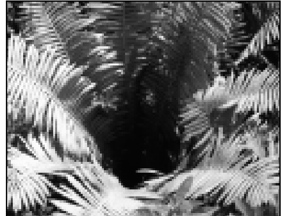
Кыала армуду кыудурет!

Сөвер Америкада индеецлени туудуклары АШШ-ны правительствосундан, сөдюно оуонуна керэ, жарым миллион чактыны бир доллар аларгы керекдиле. Индеецлени содге жиберген кыагыларында айтылганыча, аланы ата-бабаларындан сыйырылган жерлени иги кесети тап хайырланымлы магнаналарына хатасындан тийишлис тенги бир фиде бермегендиле. Искре көргозюлгөн ахчаны алгыныгы ёнеми 47 миллиард доллар эди, алай судыны оуонуна керэ, индеецлеге 455 миллион доллар берилер керекди деп тохташдырылганды. Ол ачха уа 300 минг адамга тюшениркиди. «Труд» газетден.