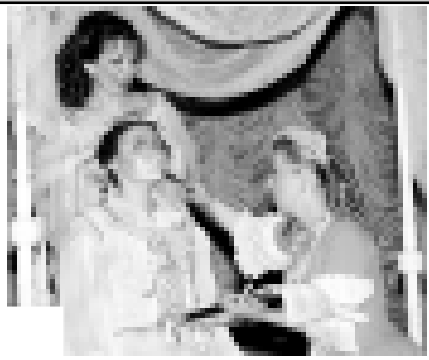
Этген эдиле. Мени оюумуа кере, ол асламысында жаш адамга деп салынганды...