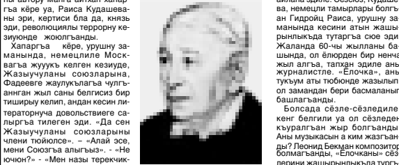
Адамлар ол заманда СССР-де зор бла кечоронго деген оюу бар эди.