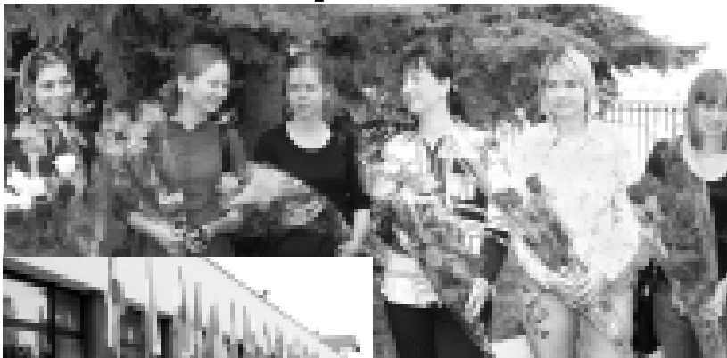
Чемпионатха келгенлени къаууму.