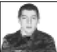
158-чи аскер полк да барган...