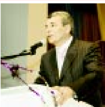
Арсен Канокъ айтхылыкъ спортчуларыбызны алгъашлайды.