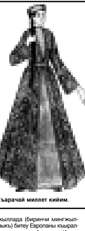
Къарачай миллет кийим.

дого жерлерине бирине дегенде да ич билериде азырандан башлап ёмюрлерде (багыр жук) жаш турган тау миллетле, арда ол тирге келген алача. Эртерге булгарла, кыпчакча сөбелет историгенде (официална версия). Бир-бир аллимле уа Кырмадан келген халкды, дейдиле. Малкъарыла жюргөн турмушга, халкыла кере уа, Къарачай (Къарачайлыны, тукумду, аны юсонден шарт билдирю жукды) кесини адамлары жууклачы, алулары, аны болсонган адамлары да алап, XIX ёмюр, жашар жериле, Бахан ауулдан кырылчы, къарачайлыны шендого жерлерине жеткенде. «Былайда жашуу этер жер барды» деп токтаганды. Ма андан бери Шимал Кавказын, Россияни, Тюркюни историйларында да айтыла келеди Къарачайны, аны биринини, ашы адамлагы Къарачайлыны, Къарачайлы жюрюнгөн халпарга XV дегенде да алапды бу халкны XV ёмюр деген историйсы.