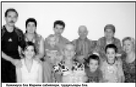
Жакимуса бала Мариам сабайлири, туудуклары блага.