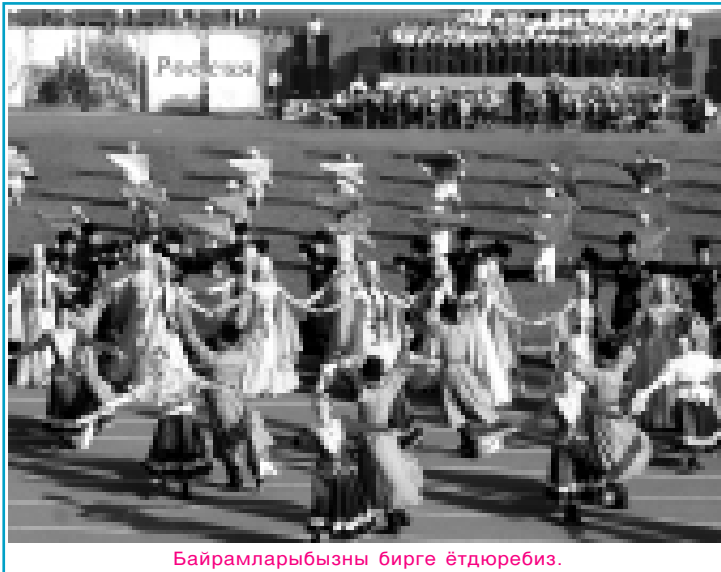
Байрамларыбызны бирге ѳтдюребиз.