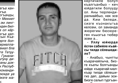
эни-эни китапла этип чыгарыла да чертгендиле ала.

рула аспандыа юйе турдыла, сабийле ёсдордиле, къырал жумушда ишлемейдиле. Биз юйорюбозде барыбыз да эркин сөлвешбиз къарачай-малкъар тилде. Аны кыс, эдиги жууктырларыбизга кеп барырга тоуюнчо эди, анда да къарачай-малкъарча сөлвешгенбиз.