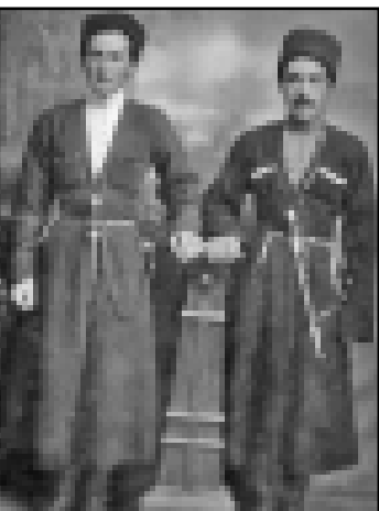
Сурат 1917 жылда Нальчикде Беренини сурат студиясында алынган. Революцияга дери таулуу жашау блай кийингенди. Акча, эгече, кой биче тикен кыптап, чекене, бөркө, Акылада уа сахтия чурукла. Кыма бля керох а дайм да биргелерине болганды. Революциядан сора аз-азадн европалы кийимге көчкөндиле.