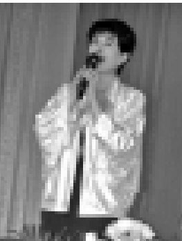
Сахнада - Асанлыя Кулина