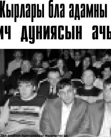
Эл сойноп тынгылады жырчыларга.

Жырлары бла адамны ич дуниясын ачыкыйлайды... «Билейт кычулары ингилде кеп болушса...»