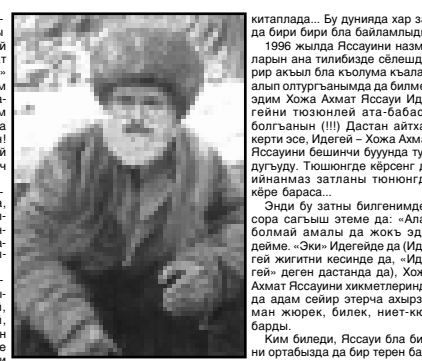
Метерпин Шыкында, Кязимни кизи ойчогондо арабында ачыт турма.