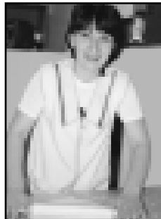
Малкъондулары Захиданы хыччилер Бютонда бек жаратадыла.

«Балкарская кухня» деген жазуучу эслеп, иги кесек жол къоратхандан сора машинаны артка бурдукъ.