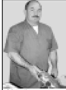
Габоланы Керим таулу жашла келтирип сатхан этте не заманда да ырызды.