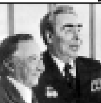
КПС-м ЦК-м и секретарь нэхьхэ Брежнев Леонид иригтэбэлгаач. 1976 гээ