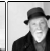
И теплээр икхуэжауэ. 1985 гээ