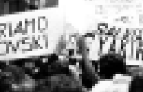
Букоскэм кызырбгэдэклэр иригтэбэлгаач пахукум ишшэ зым. 1976 гээ

Корвалан Луис паспорт нэцт хуэрэгтэбэлгаач. Идэжэ ар Колумбиан шигэ профессор, и шигуушари шигуушари, Чилим коммунист партым и паэр дыгтэгээм и 23 нилдэнэ. Мэхуэ ялшуу унафэ кляхуэжыну, Чилим Шмелен Александр Корвалан и пэ Лушэр захуэ хуунцад, и нэцлэнэ эрхэлжэ хуунцад.