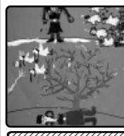
Суртхэм шыволагку зэуэм шыткыгууа лэньхэр.