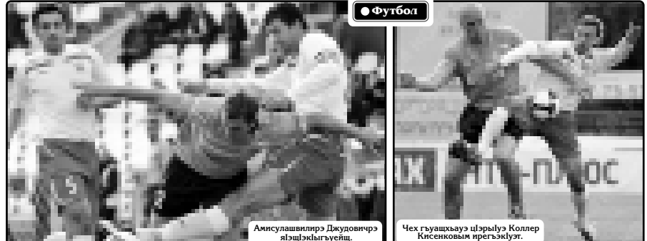
Амхулашвиллэр Джуковичрэ лэньхьыиэгууа. Чех гуаышхууа шырыгууа Коллер Кисенкович прэгэжлүт.