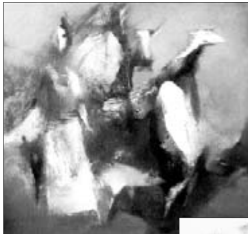
«Осень», 1992 г.

Третьеапреля – день рождения заслуженного художника КБР, лауреата Государственной премии КБР Якуба АККИЗОВА. В этот день в Музее изобразительных искусств открылась его персональная выставка.