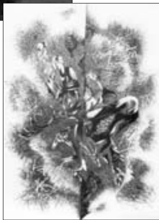
«Думая о прошлом», лист 1, автолитография, 1990 г.