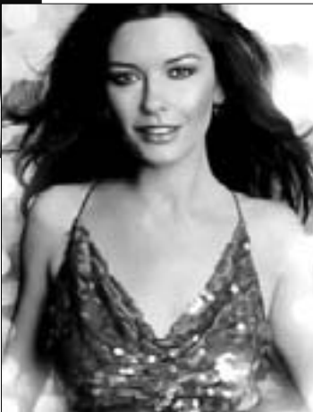
Кэтрин Зета Джонс - маленькое состояние, то декоративное, то декоративное

По одной из легенд, топоним «Англия» берет свои истоки от слова «Ангелленд», что означает «Земля ангелов». Именно так древние римляне называли эту страну, вошедшую в часть их огромной империи, из-за ангелоподобных лиц населяющих ее женщин. С тех самых пор за англичанками закрепилась слава одних из самых прелестных жительниц Европы. Неслучайно одними из самых известных топ-моделей и актрис являются подданные Соединенного Королевства: Вивьен ЛИ, Джули КРИСТИ, Кейт МОСС, Элизабет ХЕРЛИ, Кэтрин Зета ДЖОНС. До сих пор одной из популярных икон стиля во всем мире остается незабвенная принцесса Диана, ставшая первой официальной обладательницей почетного титула «Английская роза».