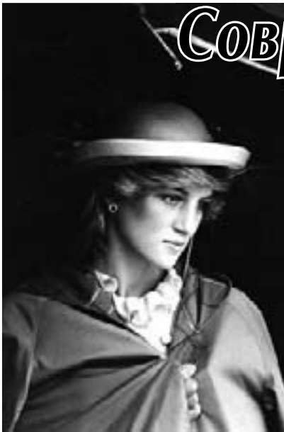
Принцесса Диана - «Английская роза»

- Одно из самых интересных открытий, совершаемых иностранцами в Великобритании, состоит в том, что произведения литературы и кино, в общем-то, говорят правду. Британцы, несмотря на сложившийся во всем мире стереотип их высокомерия, замкнутости, сдержанности и даже закрытости, на самом деле могут достаточно откровенно помяться над своими недостатками. Вот, например, образ Бриджит Джонс вовсе не является гротескным преувеличением. Англичанки действительно любят поест, особенно сладости, и поэтому ведут постоянную войну с собственным весом, так как большая их часть своей фигурой не вполне довольна.