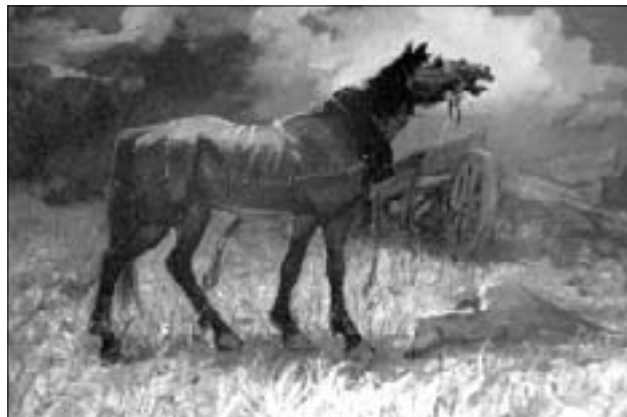
Эпизод Великой Отечественной, 1974 г.