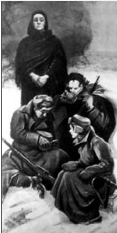
Мать солдатская, 1969-1976 гг.