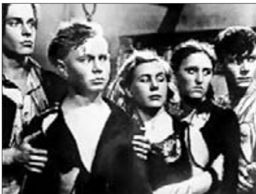
Кадр из кинофильма С. Герасимова «Молодая гвардия»