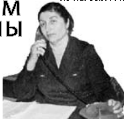
ИЗ ПЕРВЫХ РУК

Я уже не говорю о ежегодных работах по поддержанию и улучшению благоустройства села – ремонте домов и дорог, укреплении