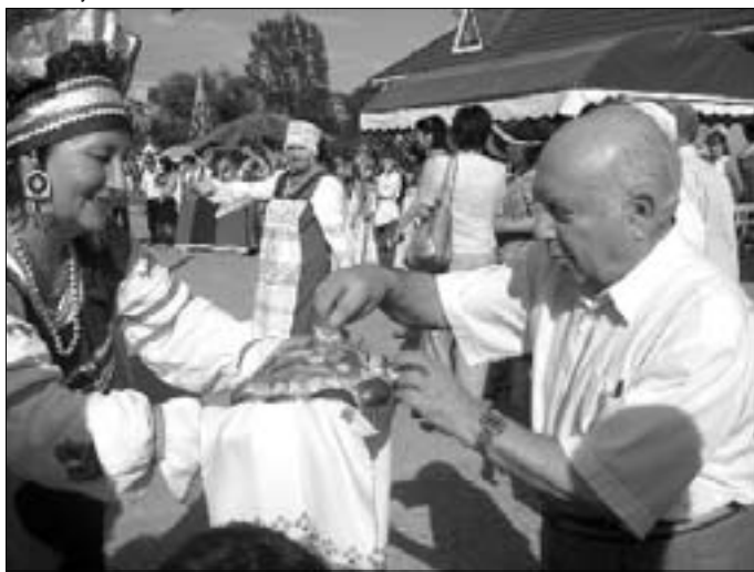
Нас встречают хлебом-солью

Накануне открытия майкопского семинара его участников и руководителей из Москвы радушно встречал санаторий «Лаго-Наки», расположенный на территории реки Курджипс – одном из самых красивых уголков Адыгеи. Последующие впечатления от мероприятия во многом сложились благодаря коллективу санатория. Свое необычно романтическое название он заимствовал из адыгейской легенды о трагической любви молодого человека по имени Лаго и девушки Наки, чьи тела упали в пропасть, а души вознеслись к небу. Но перейдем к главному.