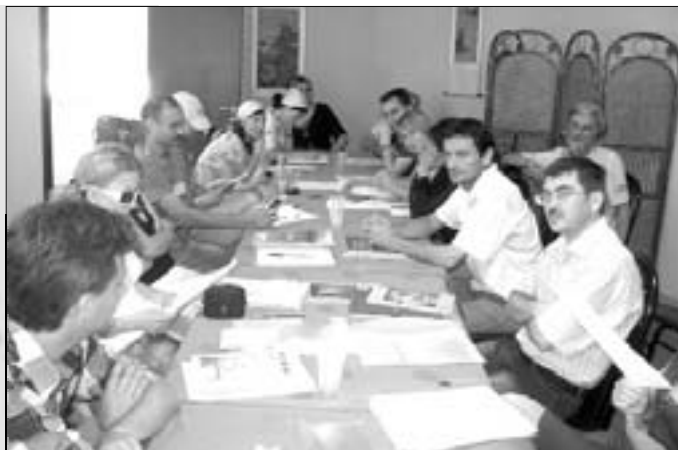
Мы на мастер-классе