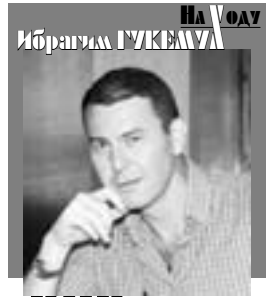
На войне, как на войне

Необъявленная война между человеком и созданной им техникой с каждым новым витком приносит все больше жертв. Будоражащие сводки с полей этой войны мы получаем едва ли не ежедневно. Кризис наступил в начале осени. Началось все с аварии на Саяно-Шушенской ГЭС и массовой гибели персонала станции. Далее – целый ряд автомобильных аварий, в том числе и в Красноярском крае.