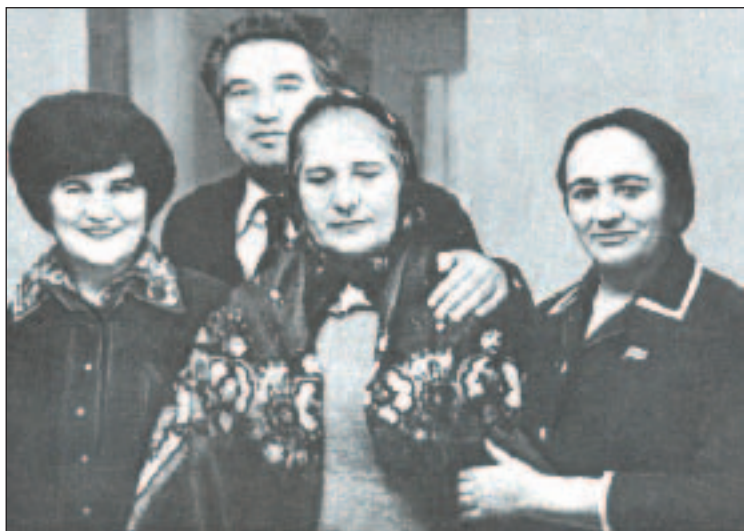
Солдан онгнга: Танзиля, Чингиз Айтматов, Танзиляны анасы Мариям, Узбекистанны халкъ поэти Зульфия