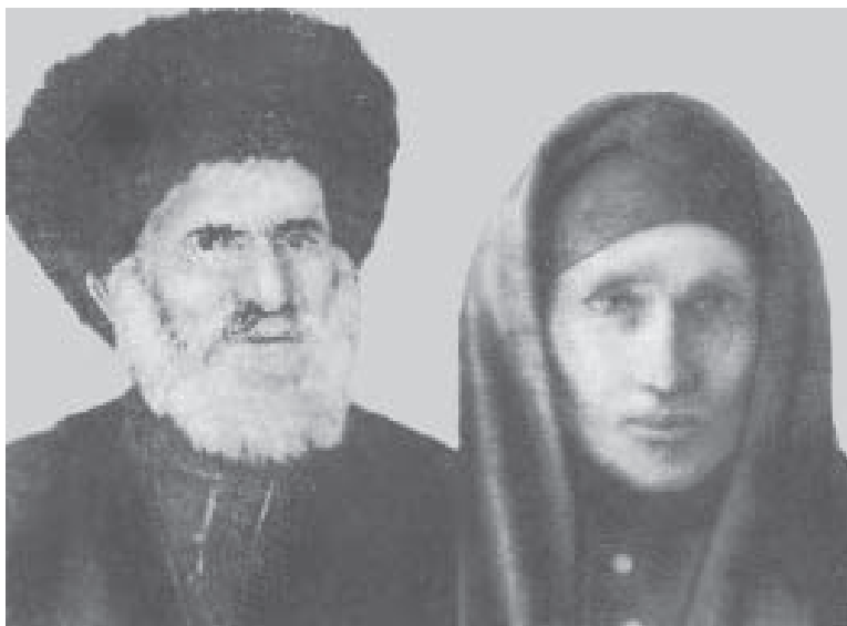
Кязим юй бийчеси Шауаланы Къанитат бла.