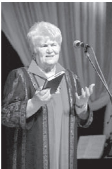
Танзиля китап окъуучу- лары бла тюбеген кезиу