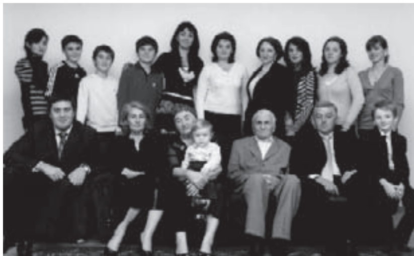
Сурагта: Паго бла Феруза сабийлери эмда туудукълары бла

Ала Паго бла байламлы бир ишни терк-терк сагъыныучудула.