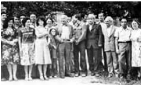
Кыщокъуэ Алим игъэхьэщIэу

Тхаклуэм и япэрэй тхыгъэ псори гъащIэм быдэу пыщIащ, абы кыышыкыу-щеклуэкIхэрщ абыхэм я нэхьыбэр зытешыкыар. Ауэ иужькIэ Къэрмокъуэм гу лъэтэ езым и гъащIэ гъуэгуанэмрэ и шхьэкIэ и нэгу щIэкIлахэмри къэбгъэсэбэп зэрыхунум, абыхэм кыызэщIэзыкыуэ къару зэрэщIэлым. Къэзэгъыу, Іэклүэлъакулэу къэбгъэсэбэпмэ, ари ехуллэныгъэм и хэкыплэ хьэлэмэт зэрыхунур тхаклуэм кыыщигъэлъэгъуащ «Азэмэт» роман цлэрыуэм. Абы и лыхьыужхэм я нэхьыбэр езы тхаклуэм фыуэ и нэлуасэ цыыхухэм къатритхыкIлащ, пэжщ, абыхэм яхэткъым ауэ сытми сурэт зытриха, дэтхэнэми кыызэщIэзыкыуэ къару щIэлъщ, хьэл-шэн пыхыкIлахэр илэщ, и псэлъэкIэ Іурылъыжщ. Абыхэм я нэхьыбэм образ нэхсэр къахищIыкIлащ, зи гугъу ищI я ІуэхущIафэхэм уагъэпIейтей, яхэпщаш ди зэманым и цыыхухэм я гупсысэ-зэхэщIыкI, Іурылъ-Іураци, я хуэапсапIэ-ІуагъапIэхэри. Аращ абыхэм кыызэщIэзыкыуэ къару щIащIэлътыр, зэманым и нэпкъыжьбелджылы щIатеплыагъуэр.