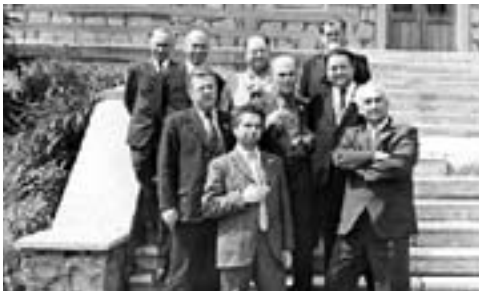
«Ленин гъуэгу» газетым шыщылэжъа илъэсхэм. И лэжъэгъухэр цыгъуэу

кызырышыхуар белджылы кыпщаци «Бахъсэн уэр» (1964) зыфища и япэ тхылъым ит рассказ шхъэхуэхэм. Псалъэм шхъэклэ, «Фатимэт зейншэкъым», «Лэгъулэжъым и гүфлэгъуэр» тхыгъэхэр, журналистым и образ зэрыхэтым и гугъу умыщыххэми, гъунэжу радиоклэ къат, газетхэм кытехуэу шыта очеркхэм къазырышхъэщыкл шлагъуэ шылэкъым. Дэ и гугъу тцыххэркъым абыхэм лъабжъэ яхуэхуар гъащлэм пэжу кызырышыхуами, зэхъуэкыныгъэшхуэ абыхэм зэраримытаи.