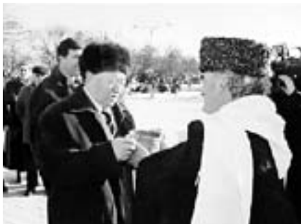
Илъэс 75-рэ щиркыу махуэм зейкыуэдэхэм ирагъэблэгъэжауэ

Къэрмокъуэм сытым щыгъуи щлэ гуэрхэр къелыхъуэ, и художественнэ лзагъым хегъахъуэ, гъащлэм и къэгъэлъэгъуэклэ лэмалыщлэхэр къегъуэт. Иджыри кыздэсым итхэхэм къашхъэщыкыу, илъэс зытлуш ипэклэ абы кыдыдигъэклащ «Хъэтлохъушыкыуей хъыбархэр» тхыгъэ гъэщлэгъуэныр. Зэ еплъыгъуэклэ, кыпфлэщынкыкы хъунуш ар тхаклуэм нэхъ пасэхэм итха очеркхэм къазэрэщхъэщыкыкы щлагъуэ щымылэу, кыыщалъхуа къуажэм щызекулэу хъыбархэр кыыщыгъэщлэрэщлэжа тхыгъэу, луэрылуатэм щыщ таурыхъ кызырэгуэклэу. Пэжщ, тхылъым ихуа тхыгъэхэр я жанркыкы зэщхъэщыгъэкыгъуафлэкъым, абыхэм ящыщ куэдым я фэсэти къэбэрдей литературэм зэкыкы хэткъым, ауэ я ухуэклэ-гъэпсыкыкыкы ахэм я нэхъыбэр ди