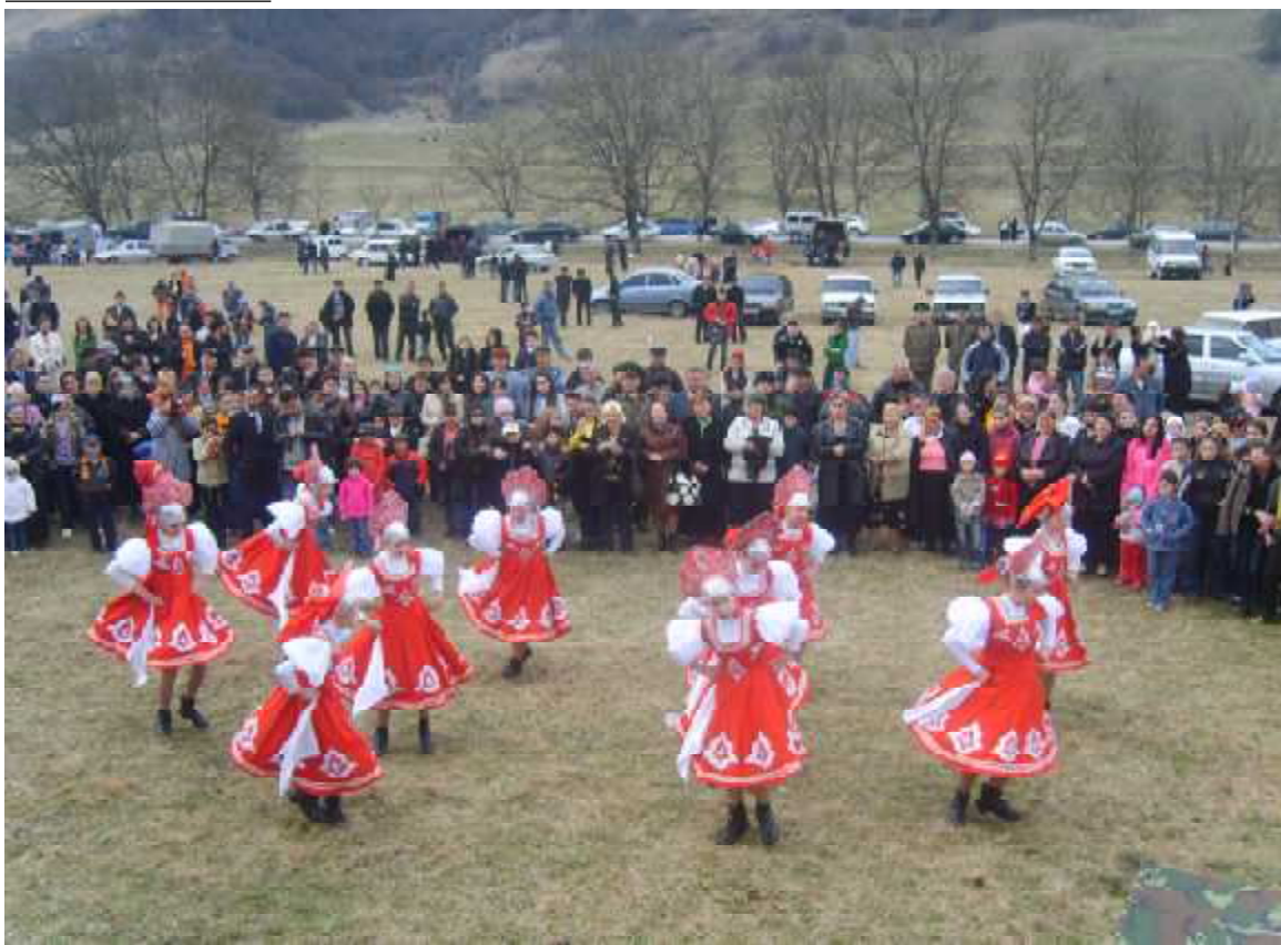
В Черекском районе состоялся праздник, посвященный Дню возрождения балкарского народа. В нем приняла участие делегация Майского района. Материал об этом читайте на 2 стр.