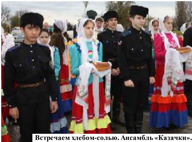
Встречаем хлебом-солью. Ансамбль «Казачки».