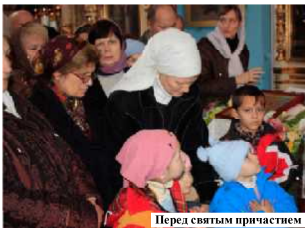
Перед святым причастием