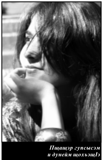
Пиццарэ гупсысэм и дунейм цохъэщIэ

Хьэмблур шым пхышурэ гъуанэщIанэ зришIым ешхыркыабзэу, лъагъуныгъэр гум къыпщхьэщ, и зы кълапэм къышышIдзэри, кIуэтэху нэхэ ин хьууэрэ, ар зэррытцIу зэщIагъэ. Зи си пщIыхъэпIэ къыххуэнтэжкъым а узыр сэ сэфыкIыну. ПэщI, ар узщ, къызырришIэкIымыкIэ, зэрришIауэ, сыкъыишIауэ зыгуэрми, софыкI. СхулэжIамэ, а си гум хэтIысхьауэ, итIысхьауэ ис лъагъуныгъэм и зы кълапэр къзубыдынтэ, къыххэсэфыжынт. Ауэ гур гъуанэщIанэ хьунуц. Кыжыгъуеу Iуэгъэр жыантIэми тегушхуэуафIэ ящIынущ, япхьэщынуц. IэфIагъэ фыгуэгъэм я нэхъыфIу шьIэм уебнэмэ, ухуэмеймэ, гъащIэм и хуабагъэ пхуэхэхэщIэрт! Цыху кьарур зэпмэщIэнтэ лъагъуныгъэр, ар къырхьэр дэтхэи зыми и гум. Ухуейм, узкIэ еджэ, ухуеймэ, тыгъэм я нэхъ лъапIэм хэбжэ - гур дзэщIэм лъагъуныгъэри