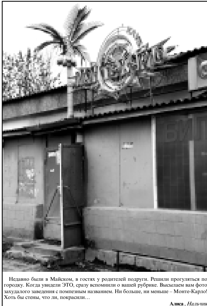
Недавно были в Майском, в гостях у родителей подруги. Решили прогуляться по городку. Когда увидели ЭТО, сразу вспомнили о вашей рубрике. Высылаем вам фото задулового заведения с помпезным названием. Ни больше, ни меньше – Монте-Карло! Хоть бы стены, что ли, покрасили...