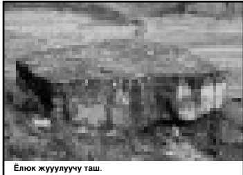
Елок жуулуучу таш.