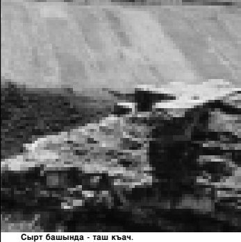
Сырт башында — таш кыач.