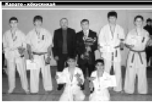
Карате - кёкүсикнай