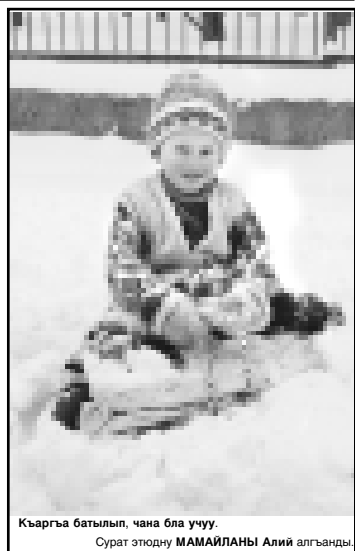
Кыарга батылып, чана бла учуу.

Юг Африкада запөөдник-леде кужур белгиле орна-тылганды: «Саг болуугуз!» Бабуинле машин аларыгызга кире болукудун! Маймула туристлени улоулары эшикерин ачагы койренинде, аланы ичлеринден ашаркыкланы,