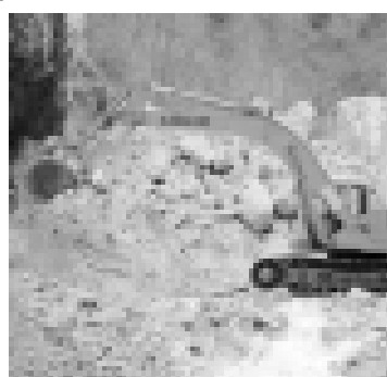
Жолну ташладан ариулайдыла.

Шёндю оператив къуаум аслам эс чекер барыра жаны ыз къурурга беде-ди. Чачдырыу ишле баш-ланганны алайдан 600-ден артыкъ кубометр таш чыгъарылганды. Эсигиз-ге сайлаыкъ, оператив