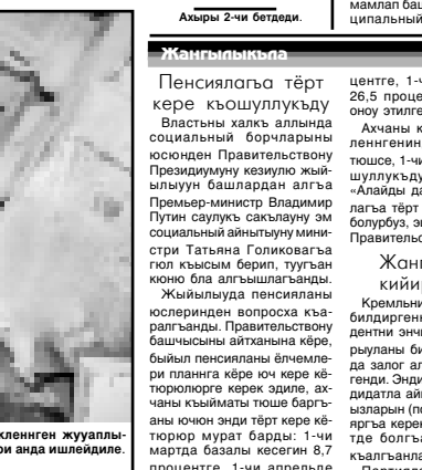
Суратны МАМАИЯНЫ Алай алганды.