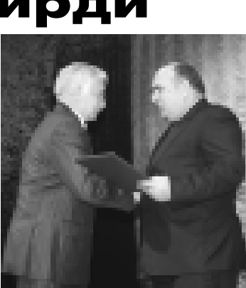
Хазратали Бердов Аттоланы Борисни саугъасы бла айтханды.