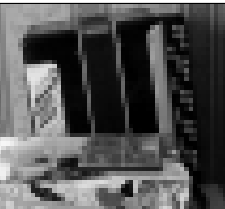
Тиширула бир бирлерине жазган писмоланы бу коробкага атадыла.

Жарышта, бир-бирле ачыкьсы бла да не торленемейдиле. Адамны сыңарчы тегиленике, жаны уа тылпысуз да болды. Ала сокур-сангыраула ушайдыла, айтханлыкъ эшитмейдиле. Алайды да, биз ишибизде да, башхаларда, кыуандырган, жарыштан затлары да бардыла.