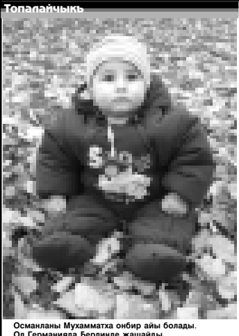
Османлы Мухаматха оңбой айы болады. Ол Германия Берлинде жашайды.