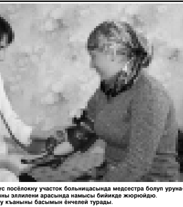
Насталны Индира Эбзуев посёлокно участок болничасында медреса болуп урунда. Ишени уста билген кызыны эллиени арасында намысы бийкеде жюрюйдю.