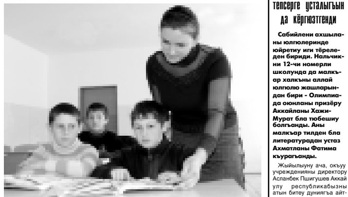
Жыйырма жыл мындан алгъа Огъары Малкъарда тыш къыраллы тилени окутуурга устанла жетишимлени келени эсериндеди. Аны анылап, бу эли жашла бла къызыла биик билим алгандан сора туугъан школларына къайтып, бөлөмлюкде жетишимли урунадыла.

на хайырлыкъларын эм квалестовларны кертюру, алай кезюуде граждандыны эркинликлерине бузукълук этилгенди жалчытуу жаны бла маддара этерлерини къаты илгенди. Андан сора да, терроризм эмда экстремизм бла байланыш уголовный ишлерини тинтилгенде, следствие органы Россейни МВД - сыны эм ФСБ-сыны оперативный бөлөмлерини бирге ишлеуу илгендируу жаны бла маддара жарышдырырга оную этилгенди.