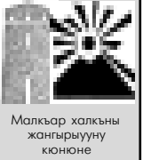
Малкыру халкыны жаңгырууну кюнөне

«Дагыстанны авиажоллары» ачык акционер общество апрельде авиаоблаштылкылары жолларын кенгертиуну башларкыды. Компанияны пресс-службасы билдиргенге кёре, келе турган айдан тебирис Россияни бир-бир шахарлары бля, ол санда Сочи, Минеральные Воды, Санкт-Петербург эм Донаггы Ростов бля да. Маршрутла республиканы эм регионун излемелерине тийишлиликке сайланганды. Минеральные Воды эм Донаггы Ростов шахарлары аэропортлары Север Кавказ бек уллулагы саналадыла эм Россияни битеу аркырапортлары бля байламлыдыла, ачык, жуук эм узак тыш кыраллы аэропортла бля да. 2014 жылда Сочиде бардырылгы Олимпиаданы алында самолёт бля учаркы ишчиле эм предпринимательле да кёп болушуклары эсге алынганды.