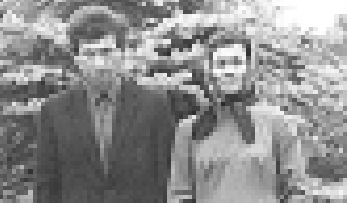
Жылга оздалды, жаш хайт деген ор болады. Муну бля уа жашуууну болуугу деген кызыгыгала Погабга – тобейди. 1954 жылда аны бля ойор кырады. Ол гителликден окуяна тизгини, иш келлю, кыумач соктыган чедах ишлегендиге.

Кечгончлоконго азаби сыналганга ага жалаанда 9 жыл бола зди Юйор Кыргыстанганга, Наукат энге тошкенди. Анда уа Суфиян ата-анасын болушур ючюн, горжебеге ише киргенди, темиринчи болушур ючюн болды. Анга эткенден ингирде тери туртогенди. Аны кел сайып ишлеенин керюп, нёгерлери атын ойнуучулары сауыгала бергендиге.