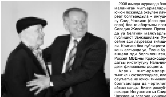
Онгдан солга: Зумакчулланы Борис Занкхшиланы Хусейини саугъалады.

25-чи майда Басманы юсюнде «Литература Кабардино-Балкария» («ЛКБ») журналны 2008 жылда басмаланганы чыгармаларына кере литература сауыганы алынганыны белгилеу болганды. Шимал Кавказда мамырлыкны бла келишулюккюню кючлеуге салгын эчки кыйыны ючюню деген мейданды берилген лауреатла. Бери белгили алимле, жазуучула, республикалы газетлени бла журналланы башчылары эм жамуаттаны келечилери да колгон эдиле.