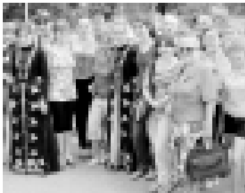
Къахшатачу сабийле къонокъала бла.

лыбызыны субъектлерини араларында байламлыкълыны жангыдан кыруарга керекди. Андан сора да, сабийлерибиз Къабаты-Малкъарны тамаша табиғатыны көрлюгенди, адамларыны аруу үткерлери бла шатырылендириди. «Мында табиғат сейрге къалдырганды. Биз тауларыны биринчи керек керёбиз. Оныры Малкъарга берген андик - сол жангыда, онг жангыда да таула. Олайыттаймаз алай сейриди! Адамла да алай къонокъа байладыла, сау болуғуз!» дей эди сабийле бир аудан, къуанчыларын букъармай.