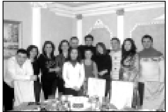
Сыйоп, булинг бла кинога баргандыла.

Интернети «Одноклассники» деген сайтында «Таулула» деген бет къуралганы жылдан артык болды.