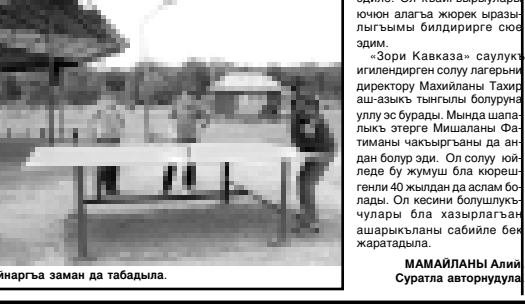
Тенис ойнаргыа заман да табыдыла.

УЧРЕДИТЕЛГЕ: КЫАБАРТЫ-МАЛКЪАР РЕСПУБЛИКАНЫ ПАРЛАМЕНТИ БЛА ПРАВИТЕЛЬСТВОСУ