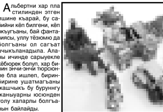
Негерланы Альберт ишлеген златя.

Негерланы Керими жашы Альберт Хасанида тууганды. Коз артында 4-чо класска барлыкты. Сабийени жаш тейноо чыгармачылык ююнде «Асаа сабий киноло тейсе аксабийни орта кызуумуна бла ондагы сурат ишлеген эки скульптурга юйрөтөн бөлмө жорюп турганды. Биологкоде бу факмулу жашчыксы бе сойен иш пластинден жаныуорланы, адамданы, юлейни ишлегенди. Жайда аны, 1-чи номери Исустовланы школууда экзамене беренинден сора, окултурга класска алганды. Вокалга хунери барды деп, ары да жаздырганды.