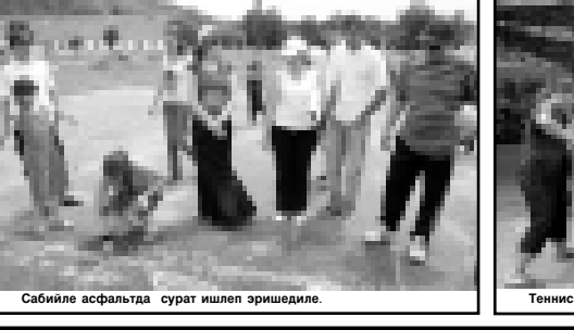
Сабийле асыфатда сурат ишлеп эришедиле.