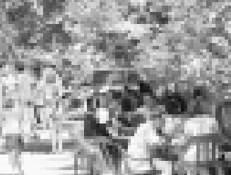
Ишчи ийикъе социалгъандан сора кафеде солугъан хычуунду.