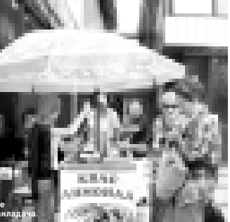
Мында да хар ким кеси жагъады. Терки ийикъе сайлайды.