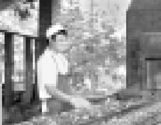
Табийгъатда этилген ишликле татылуу болдыла.