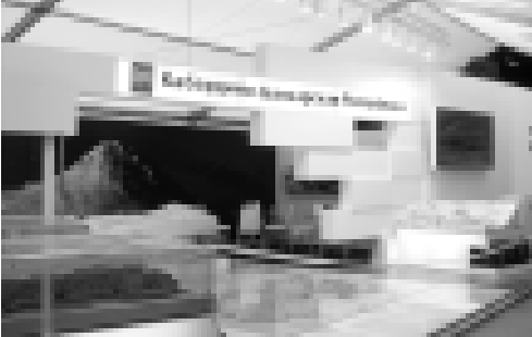
Кёрмючде Къабарты-Малкъарны стени.