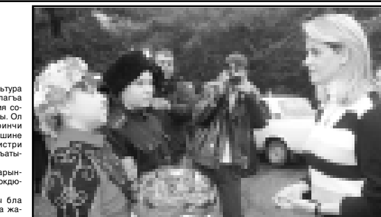
Къонокълагъа туз-гыржын бла тоюбегенди.

Россия Федерацияны субъектлеринде кырлар эм муниципальный музейлеринде къырталы музей фондун сакълау; Россия Федерацияда 2020 жылга дерик театр искусствону айнытууну концепциясына къарау; федеральный законну «О культуре» деген проектни сююу; Координация советни ишине кытышканды 24-ию сентябрде «Элбрусда той» деген халкъла аралы фольклор фестивалыны ачылыгына аталган байрам концертге да къараркъдыла. Фестиваль 26-чи сентябрде бошалыкъды.