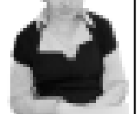
Ачы жерни алган Диналаны Амина.

«Креветение» уа, устаала Бзыланы Светлананы бла Жангоразыны Лизаны кыагында жазылган соруларына жууа албер, эки кыуумга келешини эришгенди. Мында