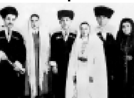
Солдан онгига: Уналаны Келлет, Къужюналаны Байханат, чеченилжаш, Чочуланы Назифа, Сараккуланы Азрет-Алий, Батчаланы Мару...