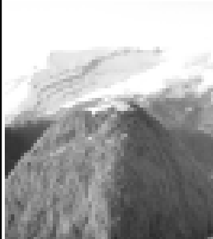
Сурат элпуду Мамайланы Алий алгьандь.