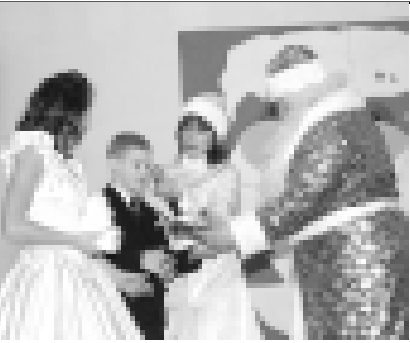
Кыр Апна сабилени кыуандырды.

ХОЛАЛАНЫ Марзият. Суратны автор алганды.