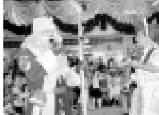
Къар Алпа бла Къар Къыз сабийлини жокалагъандыла.