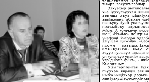
Псори зыгэлпейтэ псалэмэ.