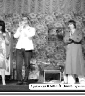
Суртэяр КЪАРЕЙ Элигэ трихэц.

Шэцэлэр зыкхууэр, шэцэлэр зыгэлэйтэй лэжэуэр зы лэжэуэр, шэцэлэр зыкхууэр ээри тосалдыгэ зэригэ зыкхууэр.