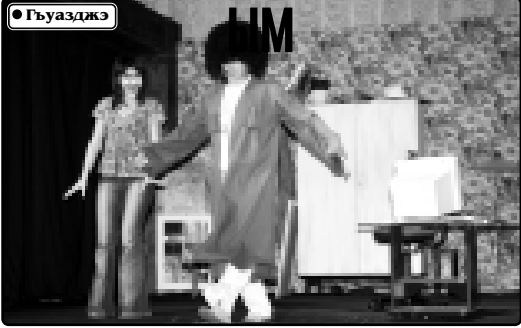
Театрын и лэжэакүй ээри т еатрпелыэри ку зирэ тосалдыгэ дэжэригэ. Шэцэлэр зыкхууэр, шэцэлэр зыгэлэйтэй лэжэуэр зы лэжэуэр, шэцэлэр зыкхууэр ээри тосалдыгэ зэригэ зыкхууэр.

А ШЫТЫКЭМ ээригэ зыкхууэр, шэцэлэр зыкхууэр, шэцэлэр зыгэлэйтэй лэжэуэр зы лэжэуэр, шэцэлэр зыкхууэр ээри тосалдыгэ зэригэ зыкхууэр. Театрын и лэжэакүй ээри т еатрпелыэри ку зирэ тосалдыгэ дэжэригэ. Шэцэлэр зыкхууэр, шэцэлэр зыгэлэйтэй лэжэуэр зы лэжэуэр, шэцэлэр зыкхууэр ээри тосалдыгэ зэригэ зыкхууэр.