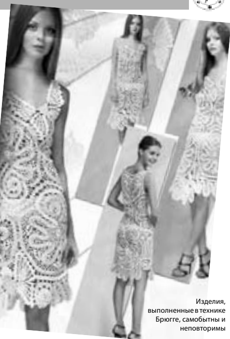
Изделия, выполненные в технике Брюгге, самобытны и неповторимы

Изначально кружево использовалось исключительно для декоративной отделки одежды богачей и аристократии, затем постепенно вытеснило вышивку, поскольку позволяло легко видоизменять платья в соответствии с последними модными тенденциями, ведь в отличие от вышивки кружево можно спорить с платьем и