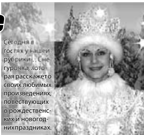
Сегодня в гостях у нашей рубрики... Снегурочка, которая рассказывает о своих любимых произведениях, повествующих о рождественских и новогодних праздниках.

Ну а во вторую группу можно включить произведения не столь известных писателей, или, наоборот, не столь известные произведения знаменитых авторов. Например, мало кто знает, что великий ДОСТОЕВСКИЙ является автором замечательного стихотворения «Божий дар», а шведская писательница, лауреат Нобелевской премии по литературе Сельма ЛАГЕРЛЁФ написала не только историю о чудесном путешествии мальчика Нильса с гусями, но и «Святую ночь» или что именно на время зимних праздников как-то раз выпали приключения Шерлока Холмса и доктора Ватсона в рассказе Конан Дойля «Голубой карбункул». Тему Нового года не обошли в своем творчестве и знаменитые братья СТРУГАЦКИЕ, написавшие повесть «Понедельник начинается в субботу» – если вы ее не читали, то все равно с ней знакомы, так как по ее мотивам поставлен культовый фильм «Чародеи». Уникальному, сугубо российскому хронологическому явлению