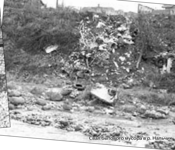
Свал бытового мусора в р. Нальчик