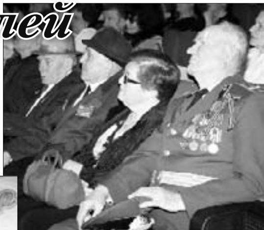
Ветераны слушали песни о войне иначе, чем мы