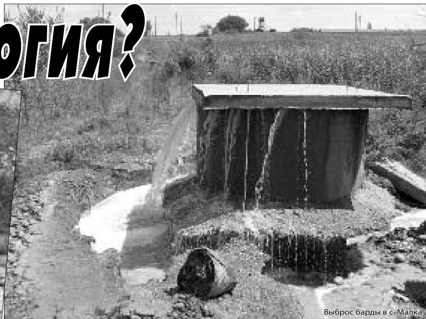
Выброс барды в с. Малга