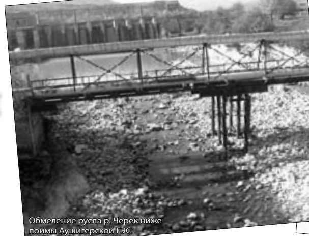
Обмеление русла р. Черек ниже поймы Аушигерской ГЭС