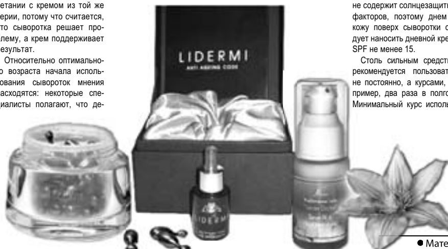
• Материалы полосы подготовила Наталья ПЕЧОНОВА

Будучи продуктами направленного действия, сыворотки классифицируются: для лица, шеи, области вокруг глаз и бюста. (Пользоваться сыворотками для лица в области глаз нельзя, потому что к сывороткам для глаз предъявляются особые требования: их pH должен быть нейтральным - 7, как у слез. Уровень pH остальных сывороток колеблется от 5 до 6,5.) Поэтому, чтобы подобрать сыворотку, следует определиться, какую косметическую проблему необходимо решить, а их названия говорят сами за себя: «Интензивный уход: сияющая кожа», «Идеальное питание», «Матовый эффект», «От мешков и кругов под глазами», «Здоровый эффект», «Для разглаживания морщин», «Омолаживающий комплекс», «Антилигменты» и т.д. Несмотря на то, что дорогостоящие сыворотки продаются в небольших флаконах, скептически относиться к этому не стоит, так как каждое использование требует всего несколько капель средства, и поэтому флакончика хватает надолго.