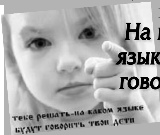
ТЕБЕ РЕШАТЬ – НА КАКОМ ЯЗЫКЕ БУДУТ ГОВОРИТЬ ТВОИ ДЕТИ

Повторюсь еще раз: нам надо найти в себе силы взяться за руки. Да, есть дефицит молодежных лидеров. Примеры, образцы для подражания отсутствуют и в жизни, и в современном искусстве. Но будем все же надеяться, что скоро выбравших оружие и насилие среди нас не будет. Удачи всем нам!